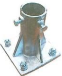
patka a sloupek