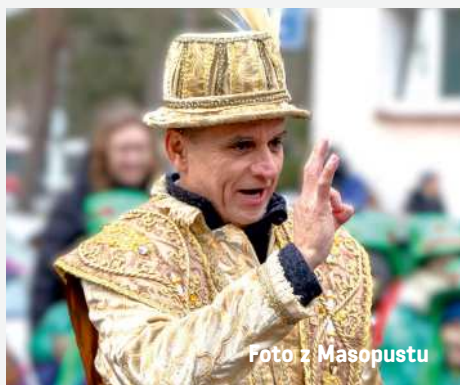
Foto z Masopustu

V Pardubicích jsme si už na Vánoce bez sněhu zvykli a ty poslední nebyly výjimkou. Nicméně na konci roku a v průběhu měsíce ledna přišlo několik sněhových přeháněk a několikadenní období poměrně silných mrazů. Po delší době jsme tak i v Pardubicích poznali, jak vypadá zimní počasí. To vše umožnilo nejen dětem v Polabinách vyzkoušet si jízdu na saních, stavbu sněhuláka či bruslení na Bajkale a slepých ramenech Labe. Sněhové radovánky byly určitě příjemným zpestřením pro děti.