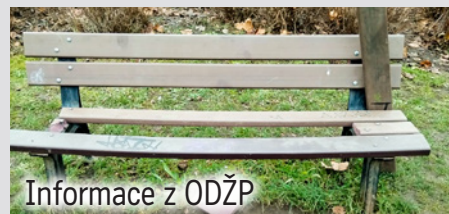
Informace z ODŽP