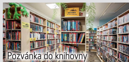
Pozvánka do knihovny