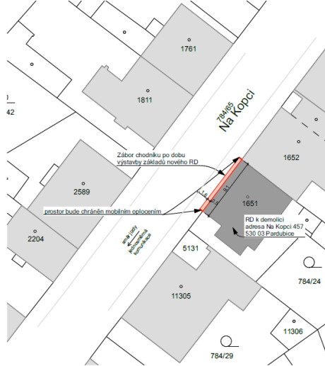
Situační výkres - zábor na adrese Na Kopci 457, 530 03 Pardubice