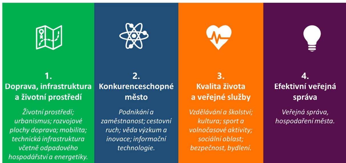
Obrázek 0.1: Pracovní skupiny SPRM Pardubice 2035

Návrhová část SPRM Pardubice 2035 je zpracována dle následující struktury: