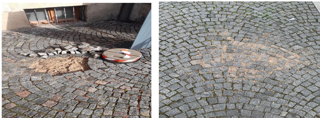
10. Náměstí republiky