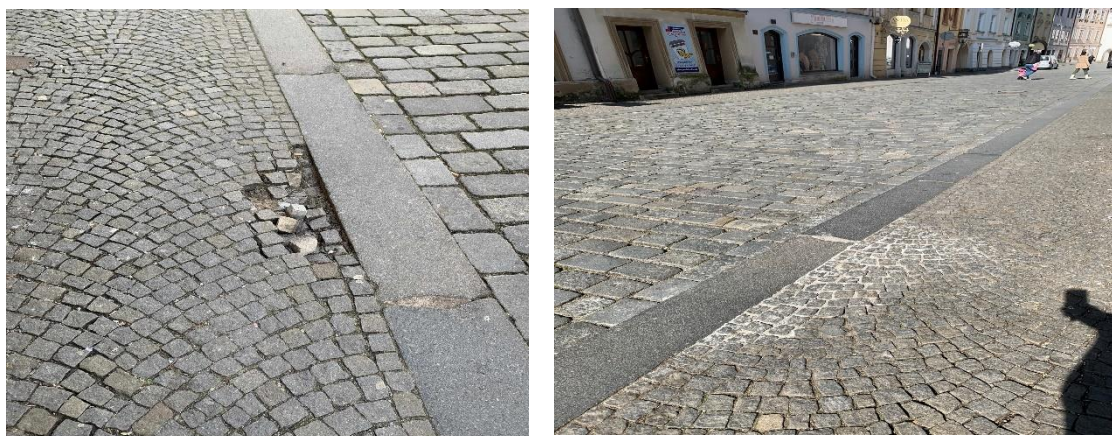
9. Pernštýnské nám.