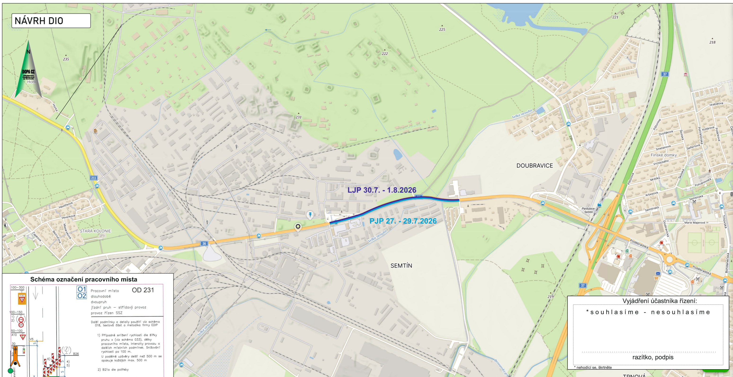
Schéma označení pracovního místa