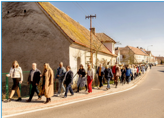
Ohlédnutí za březnovou akcí

budově bývalé školy Muzeum perníku, výrobu pardubického perníku a vytvořit prostor pro setkávání a inspiraci napříč generacemi. Plánujeme workshopy pro mateřské i základní školy, seniory i širokou veřejnost – například pečení perníčků spojené s vyprávěním o tradici perníkářství v Čechách.