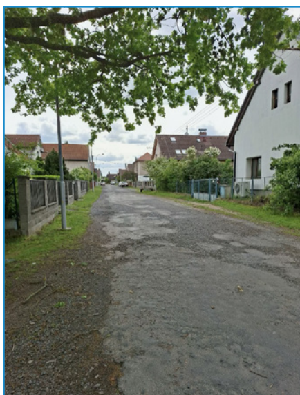
Stávající stav ulice Příčná

Uvědomujeme si, že stavební práce mohou dočasně přinést omezení v dopravě i každodenním životě. Děkujeme vám za trpělivost a pochopení. Výsledkem bude bezpečnější, modernější a udržitelnější ulice. RED