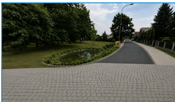
Vizualizace budoucí podoby ulice (ilustrační, vytvořeno pomocí AI)