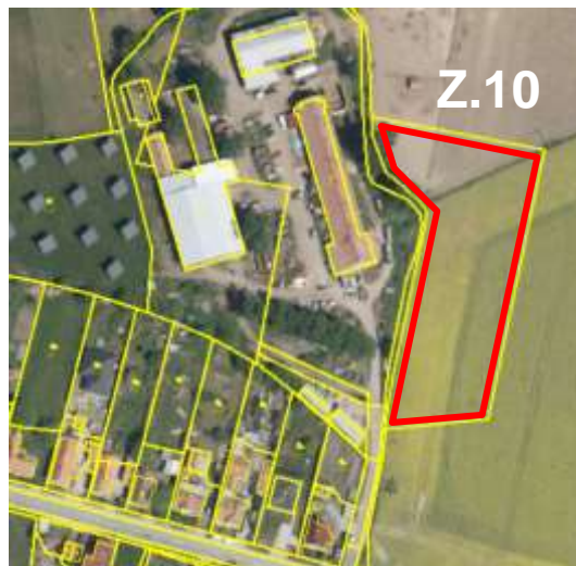
Výstřižek z koordinačního výkresu a letecký snímek.