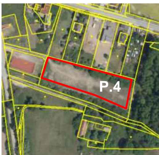
Výstřižek z koordinálního výkresu a letecký snímek.