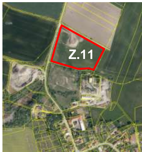
Výstřižek z koordinačního výkresu a letecký snímek.