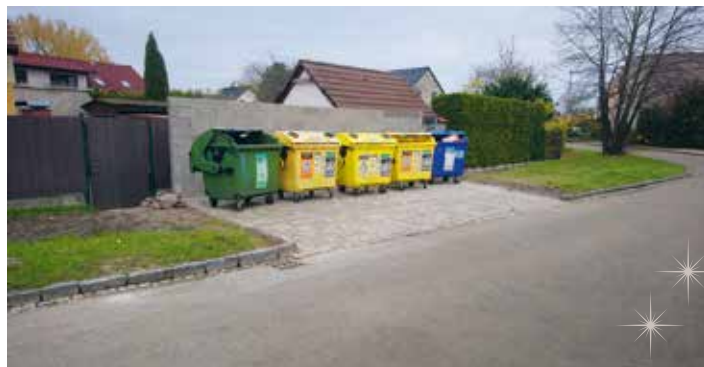
Nové stanoviště na kontejnery na tříděný odpad Trnová

Projekční práce probíhají na: stezka pro pěší a cyklisty od fary po svítkovský most, oprava chodníků před č.p. 285-287 v ul. Marie Majerové Ohrazenice, záliv pro parkování u Mateřské školy v ul. Prokopa Holého v Rosicích nad Labem a chodníky u křižovatky na náměstí Doubravice.