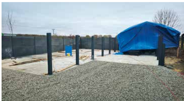
Manipulační plocha a kóje