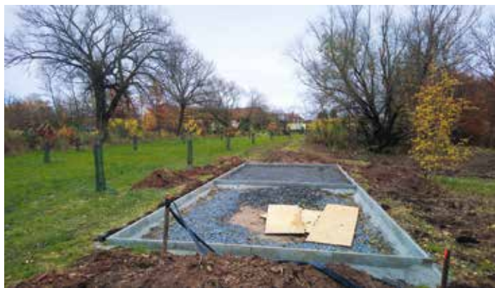
Klidová zóna sadu Rosice n/L, veřejné ohniště

Realizuje se rekonstrukce havarijních stavů na objektu hospodářského dvoru v Ohrazenicích , (manipulační a příjezdová plocha, kóje na skladování materiálů). V Trnové v ulici K Olšině se dokončuje výstavba kontejnerového stanoviště na tříděný odpad a v Rosicích nad Labem v prostoru ovocného sadu probíhá výstavba klidové zóny – zpevněné plochy a veřejného ohniště . Tento prostor čeká ještě v příštím roce další rozvoj.