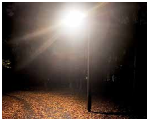
Solární lampy na stezce od Březinky přes les – více v textu na str. 1 slovo starosty