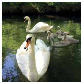
Krmít, či nekrmít?

Druhou důležitou zásadou je krmít jen tím, co je pro ptáky vhodné a přirozenou stravou. Nemálo vodních ptáků – kormoráni, ledňáčci, volavky nebo potápky – se živí téměř výlučně