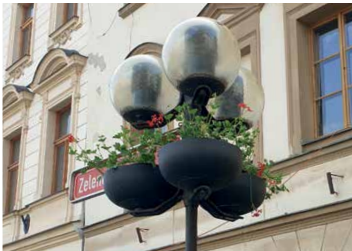
Květy rozzářily sloupy.