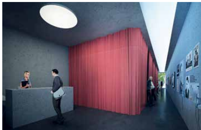
Vizualizace expozice.