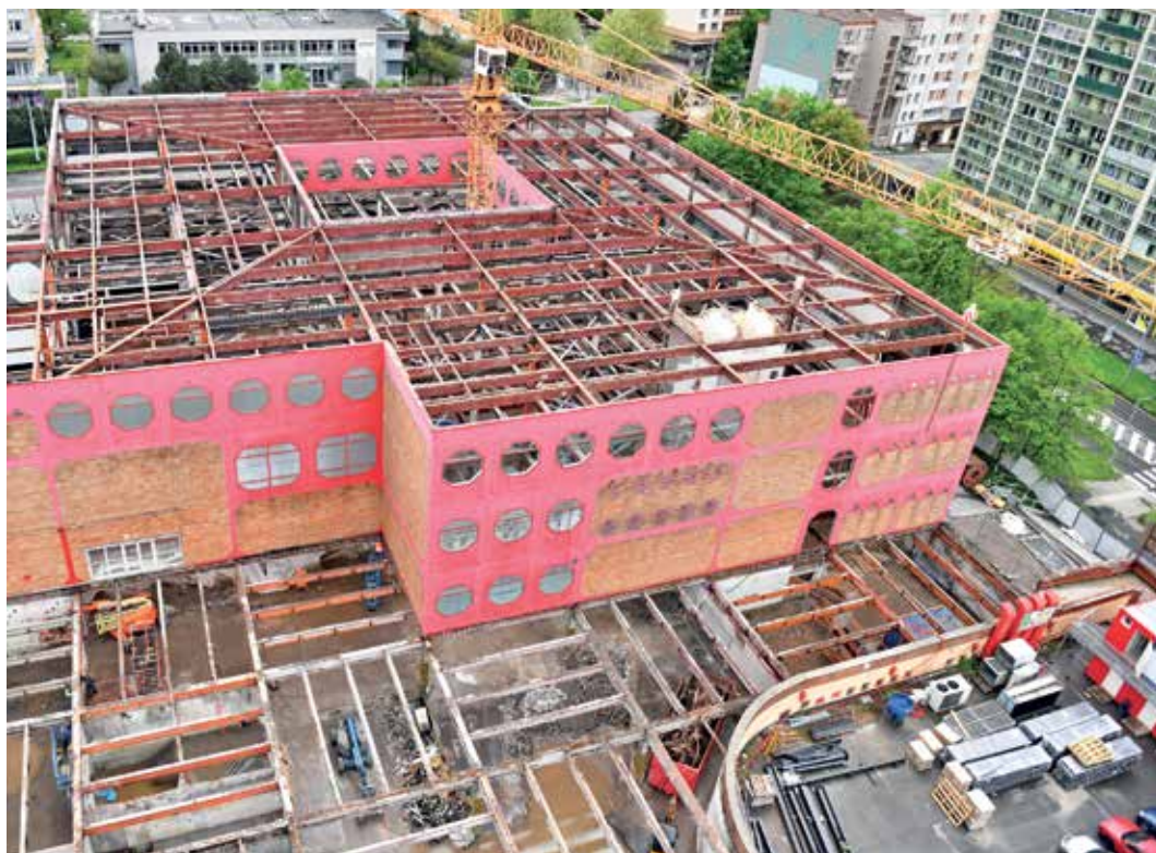
Bývalý obchodní dům Prior prochází mohutnou změnou.