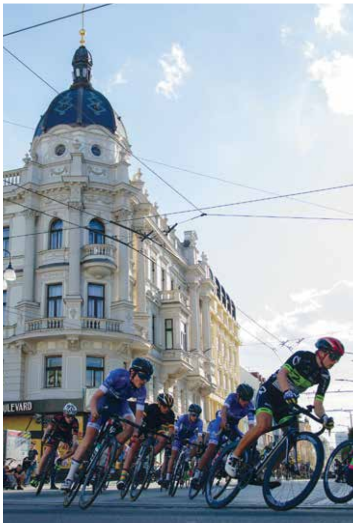
Závod pro profíky i amatéry.