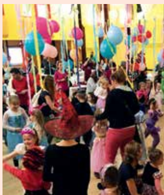
Pro děti je připraven vždy pestrý program.

Rodiče zase věří, že v naší miniškolce Sluníčko o jejich děti dobře pečují hodné chůvy, a ony si mohou hrát a smát se. Veřejnou dětskou skupinu o kapacitě 24 dětí od jednoho roku provozuje Sluníčko od roku 2016 a pomohlo tak řadě rodičů k zapojení se do pracovního procesu.