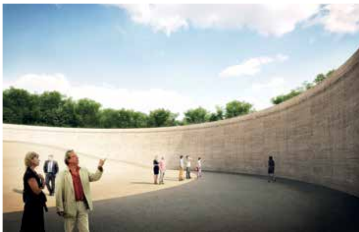
Vizualizace pohledu chodce.

v prostoru bývalého lihovaru byl velkorysý i svým pojetím architektury. Úsilí o moderní stavitelství by mělo být samozřejmostí napříč politickým spektrem městského zastupitelstva.