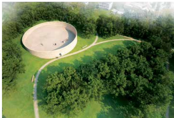
Vizualizace nové podoby památníku Zámeček.

Nicméně věříme, že s odchodem epidemie přestane upadat v zapomnění nejen historie pardubických Židů, ale že ani moderní architektura nebude popelkou ve městě, v němž žijeme a které máme rádi. Blýská se na lepší časy. O tom svědčí například areál