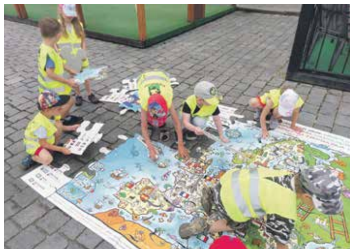
Pardubické centrum EUROPE DIRECT připravuje každoročně řadu společenských a vzdělávacích akcí.

Věříme, že epidemická situace se bude zlepšovat natolik, abychom již během prázdnin mohli připravit svůj program ve Sportovním parku Pardubice, zúčastnit se oslav Evropského dne koní, Evropského dne jazyků či Noci vědců. O prázdninách plánujeme poprvé zapojení do příměstského tábora s názvem Letem světem Evropou. Velmi se těšíme na přímou komunikaci s lidmi