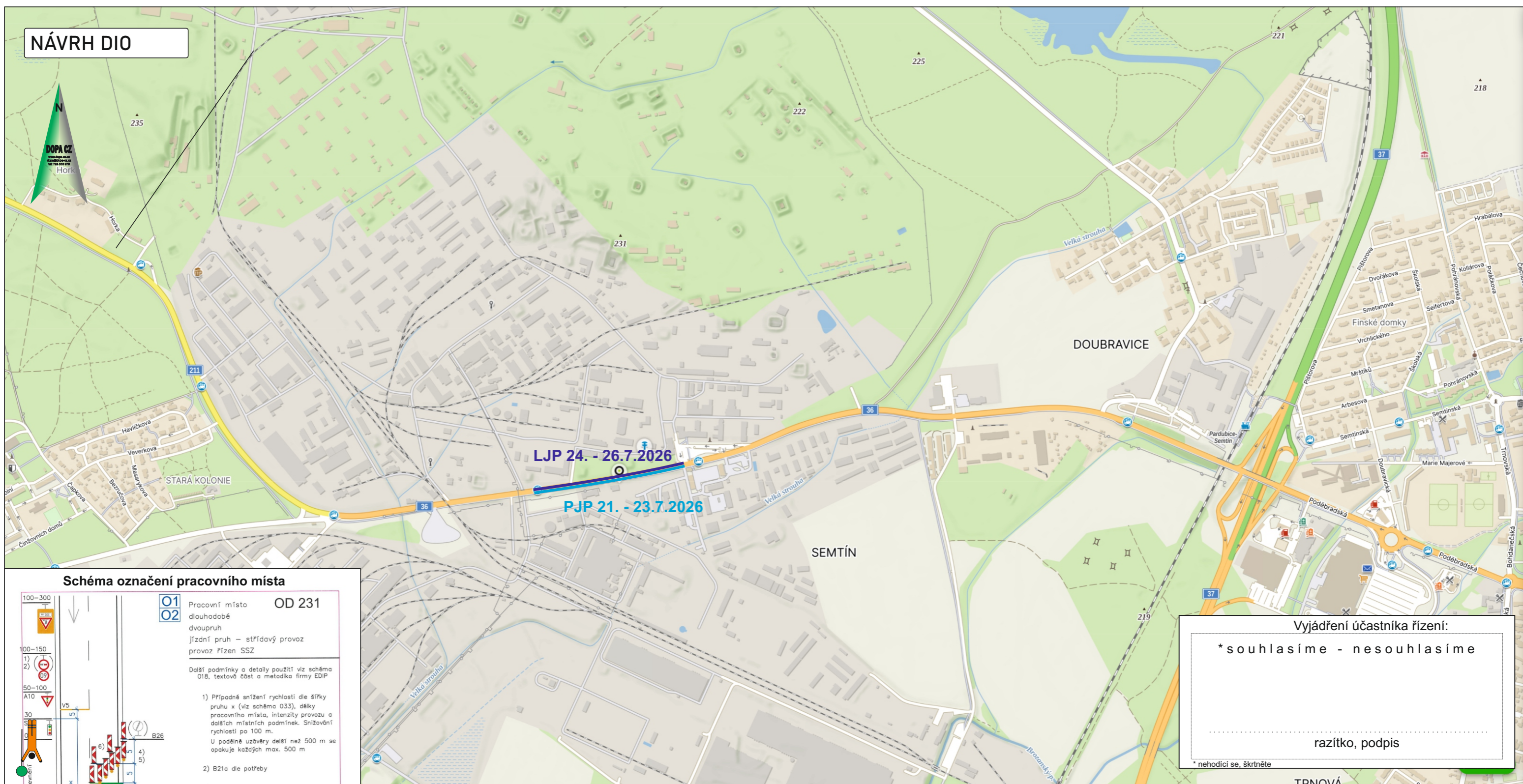
Schéma označení pracovního místa