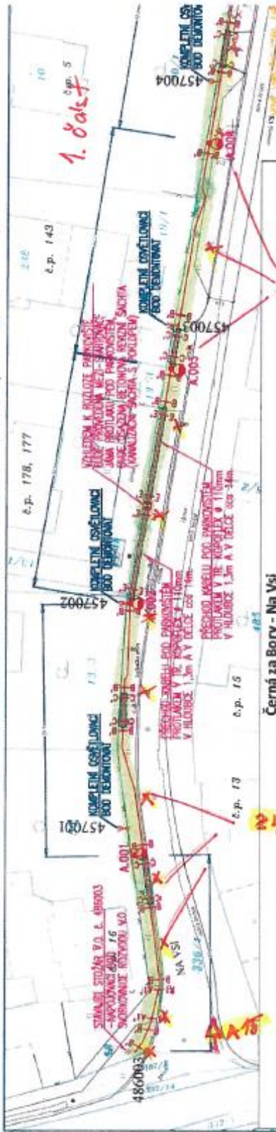
Černá za Bory - Na Vsi