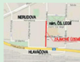
REKONSTRUKCE VNITROBLUKU U AUTOBUSOVÉHO NÁDRAŽÍ V PARDUBICÍCH Měř. 1:250 B.2.1 KOORDINAČNÍ SITUACE