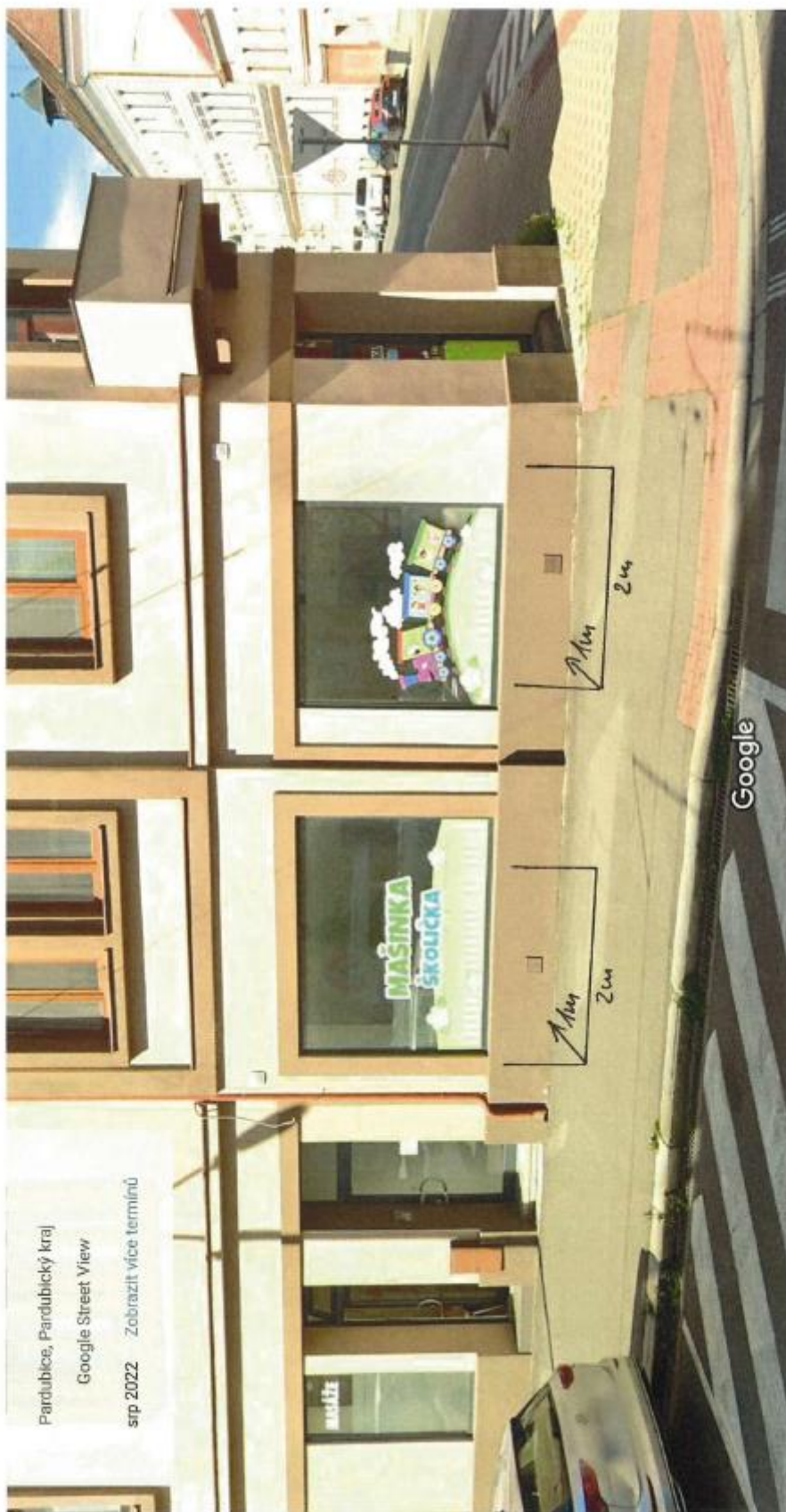
Pořízení obrázku srp 2022