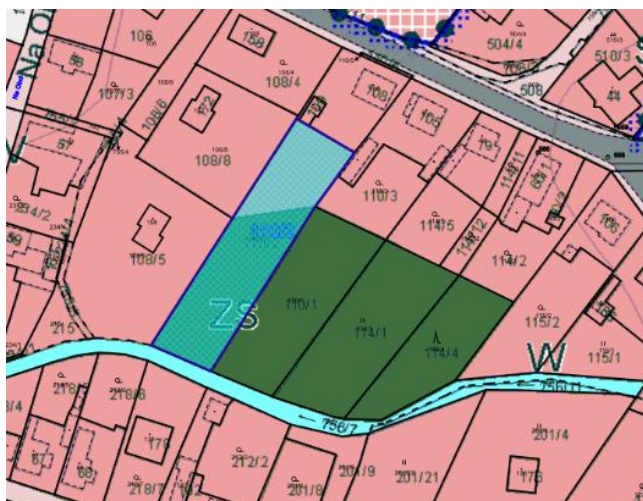
Obr. 3: Zákres návrhu č.2 do hlavního výkresu územního plánu