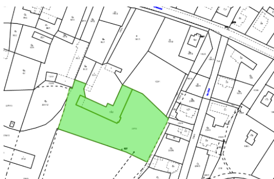
Obr. 4-5: Zákres návrhu č.3 do náhledu do katastru nemovitostí a do hlavního výkresu územního plánu