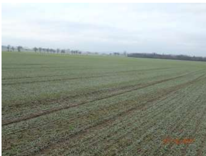
Obrázek 7 : Stávající lokalita - pohled podél silnice III. třídy č. 32226