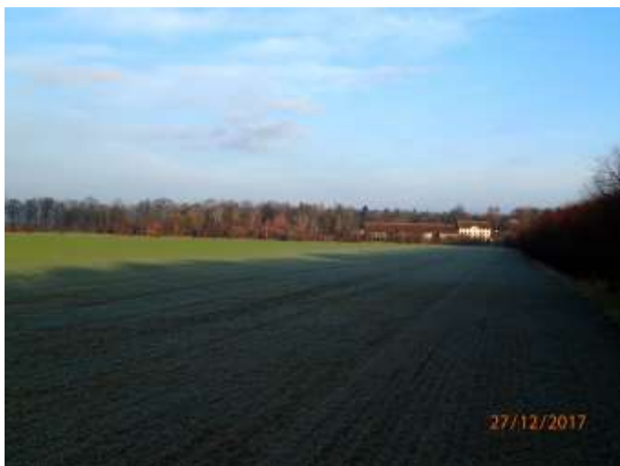
Obrázek 3 : Stávající lokalita - pohled na areál Hladíkov