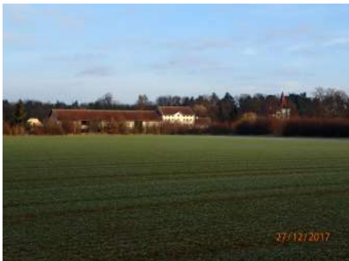
Obrázek 4 : Stávající lokalita - pozůstatky zařízení vodního zdroje