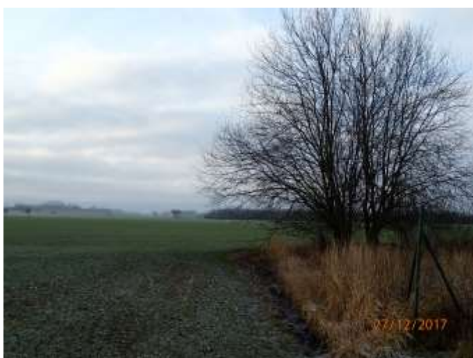
Obrázek 6 : Stávající lokalita - pohled ze severovýchodu - k obci Barchov