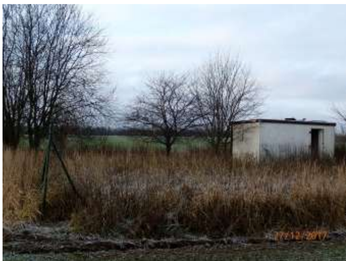
Obrázek 5 : Stávající lokalita - pohled od vodního zdroje k obci Barchov