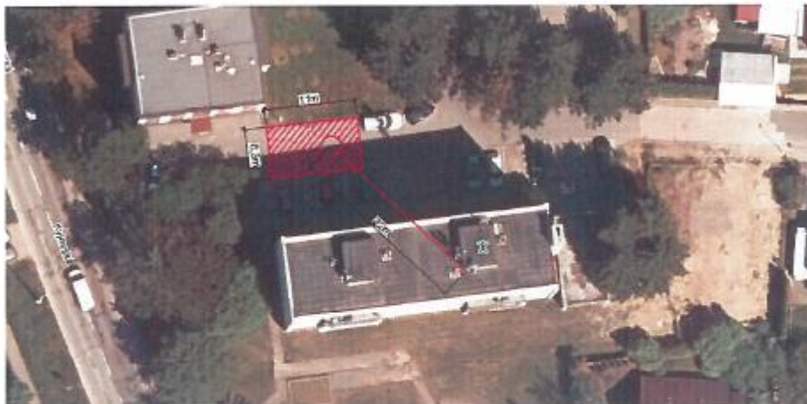
Velikost zboru pro jeřáb - 70m 2 (6,3 x 11)