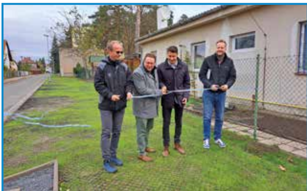
Parkoviště u SK Pardubičky