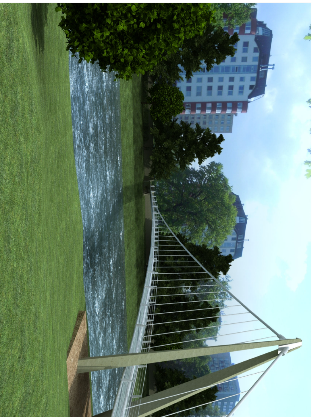
POHLED Z PRAVÉHO BŘEHU