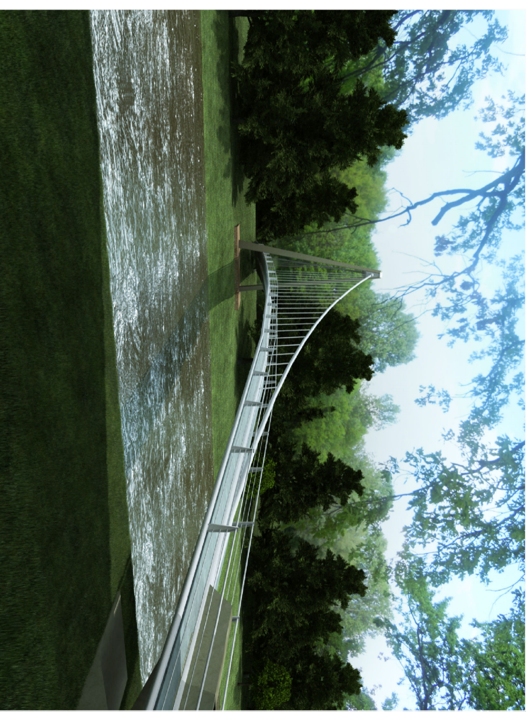
POHLED Z LEVÉHO BŘEHU