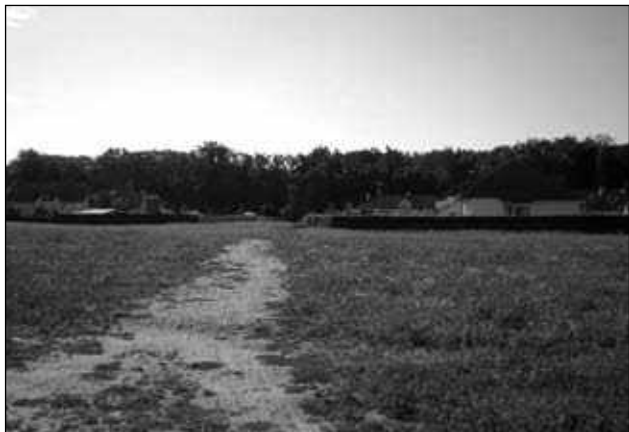
Předmět realizace této akce

Nyní se dokončuje projektová dokumentace pro realizaci akce „Propojka Lesoparku s centrální částí Dubina“. Jedná se o řešení území, které má jednoznačnou převažující funkci, neboť se jedná o hlavní a jedinou spojnicí mezi sídlištěm a Lesoparkem Dubina. Toto využití je v souladu s územním plánem města Pardubice, jedná se o území, které je v plánu označeno jako zeleň krajinná. Dojde k vytvoření propojovacích cest ze zámkové dlažby. Bude osazen nový mobiliář, celkem plánujeme osazení 23 kusů litinových laviček. Nezbytnou součástí jsou sadové úpravy, základem zeleně jsou stromy v druhové skladbě, která vychází jednak v návaznosti na Lesopark a jednak v návaznosti na zeleň v parku v centrální části Dubina.