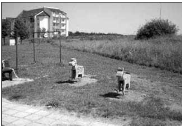
Opravené dětské hřiště – kyvadlové houpačky

Letos na jaře jsme zrekonstruovali dětské hřiště v ulici Erno Košťála u čp. 996 –997 tak, aby herní prvky vyhovovaly norám a předpisům vztahujícím se na tuto problematiku. Občané si stěžovali na neexistující zástěnu u sportovní plochy, kdy docházelo k dopadům míčů na lodžie občanů a rozbíjení skla u vchodových dveří. V rámci akce byla provedena: likvidace betonové lavičky a stávající překlápěcí houpačky, oprava pingpongového betonového stolu, montáž ocelové sítě, demontáž stávajících kyvadlových houpaček umístěných na herní ploše u čp. 994 – 995 v ulici Erno Košťála, jejich oprava, instalace rámu na novém místě, oprava tak, aby odpovídaly současným normám. Dále pak je součástí vyrobení a osazení streetballového koše s vlastní deskou na stávající betonovou stěnu, dodávka překlápěcí dvojité houpačky, instalace ochranné zástěny sportoviště se vstupní brankou, oprava sloupků a sedátka rozhodčího na sportovišti, zhotovení dopadové plochy pod překlápěcí houpačkou, zaobroubení záhonovými obrubníky, zhotovení plochy pod streetballovým košem, zhotovení dopadové plochy pod pingpongovým stolem.