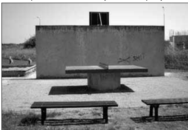
Opravený stůl na stolní tenis