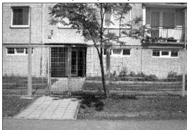
Nová zábrana se vstupní brankou

Vydává: Úřad městského obvodu Pardubice III, Jana Zajíce 983, Pardubice 530 12