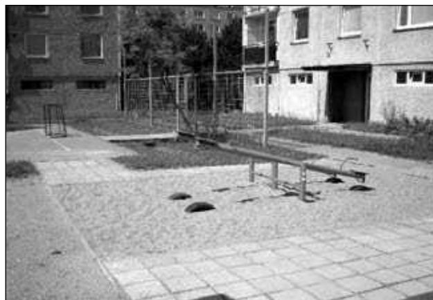
Překlápěcí houpačka dvojitá