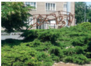
Instalace Koně na Palackého třídě