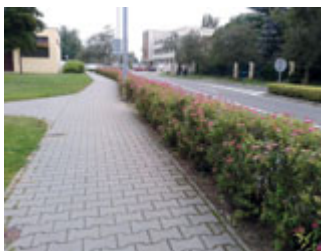
Živý plot U Stadionu

S koncem prázdnin byly opět přednostně upravovány prostory před všemi školami. Tradičně proběhly základní úpravy parkoviště a předprostoru u ZŠ nábřeží Závodu míru, Bratřů Veverkových, na náměstí Čs. legií, na Sukově třídě před Domem hudby a u Střední průmyslové školy potravinářství a služeb.