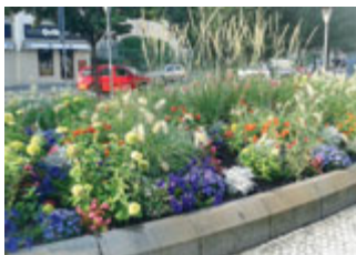
Záhon na Smetanově náměstí

V nadcházejícím období nás čeká především dotvarování živých plotů, výsadba cibulovin a podzimní výsadba keřů, plán výsadeb na příští rok a odklízení listí.