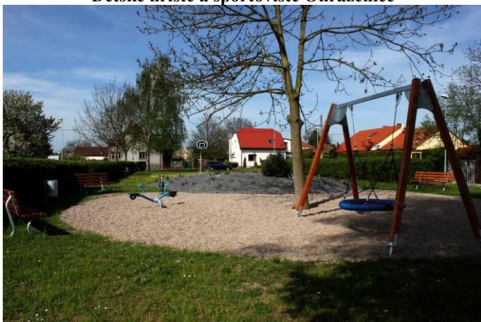
Dětské hřiště a sportoviště Ohrazenice