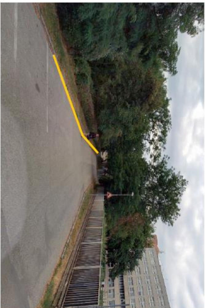
1) Stanovení vzd. V 12c v délce cca 40 m