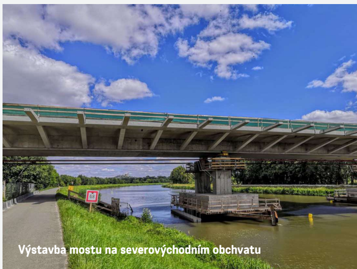
Výstavba mostu na severovýchodním obchvatu