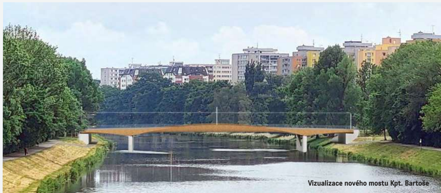
Vizualizace nového mostu Kpt. Bartoše