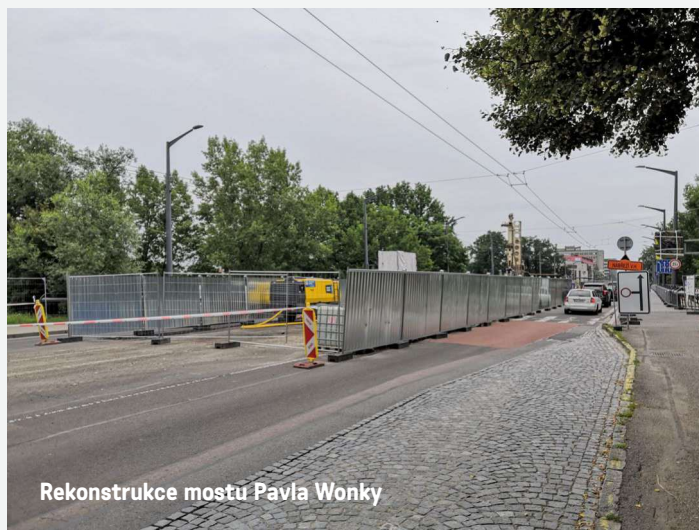
Rekonstrukce mostu Pavla Wonky